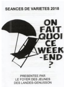
« On fait quoi ce week-end » Pièce de théâtre donnée par l'association "Le Foyer des Jeunes" à Landes Génusson en novembre 2018