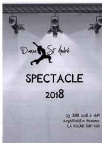
Spectacle de danse donné par l'association « Danse St André » à l'amphithéâtre de l'ICAM à La Roche-sur-Yon en juin 2018