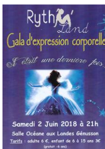
« Il était une dernière fois » Spectacle de danse donné par l'association "Rythm'Land" à Landes Génusson en juin 2018