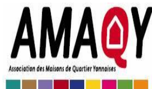
1 ère AG de l'AMAQY (association des maisons de quartier)