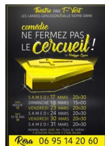
« Ne fermez pas le cercueil » Pièce de théâtre donnée par l'association "T-Vert" à Landes Génusson en mars 2018