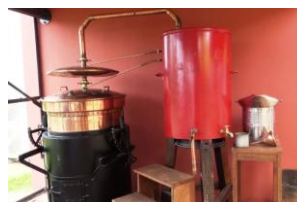
L'alambic de St André installé à la résidence du Pont Rouge Inauguration de l'installation