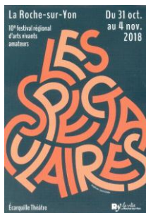
10 ème Festival " Les Spectaculaires " Festival régional d'arts vivants amateurs en octobre/novembre 2018 organisé par l'association "Écarquille"